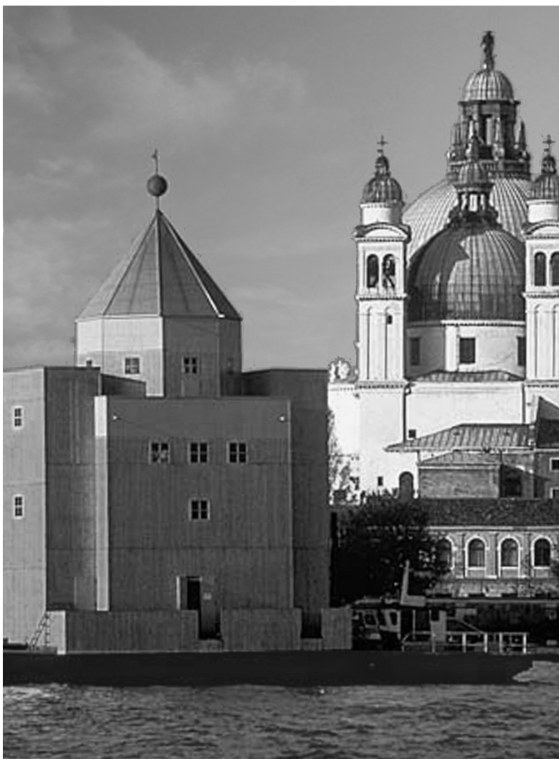
Aldo Rossi , Teatro do Mundo , Bienal de Veneza, 1979.