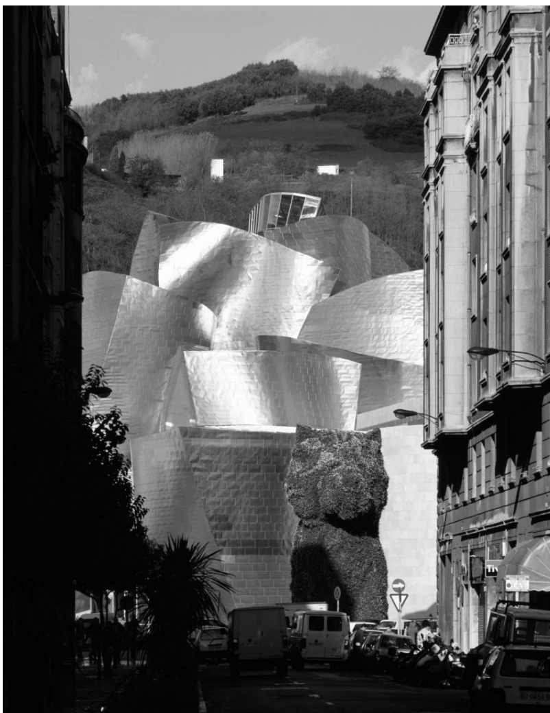
Frank Gehry, Museu Guggenheim Bilbao, 1993-97