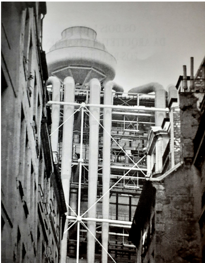
Renzo Piano e Richard Rogers, Centro Georges Pompidou (Beaubourg), 1974-79