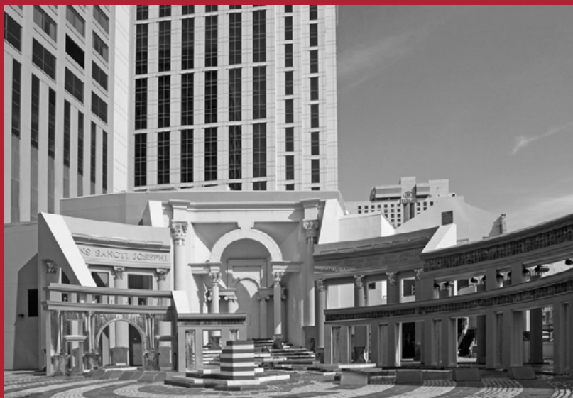
Charles Moore, Piazza d'Italia, New Orleans, 1979 (enquadrada por prédios modernos).