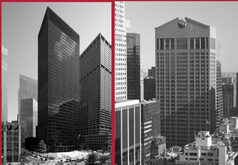
Mies Van der Rohe, Edificio Seagram, NY, 1958.