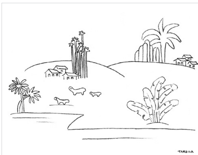
Tarsila do Amaral. Paisagem antropofágica - I, 1929 c – lápis s/ papel, 18,0 x 22,9 cm. Coleção Mário de Andrade. Coleção de Artes Visuais do Instituto de Estudos Brasileiros USP.

O novo tempo do mundo exige dos intelectuais responsabilidades que lhes são intrínsecas: a de tornar a força das ideias parte do movimento de entendimento e transformação do mundo. Os filósofos Otilia Beatriz Fiori Arantes e Paulo Eduardo Arantes cumprem, juntos, há mais de 50 anos, a tarefa da crítica como intelectuais públicos atuantes, transitando entre diversas áreas das humanidades e da cultura, em diferentes audiências e espaços de formação. A coleção Sentimento da Dialética é um lugar de encontro com a obra de Otilia e Paulo Arantes e reafirma o sentido coletivo da sua produção intelectual, reunida e editada em livros digitais gratuitos. É um encontro da sua obra com um público cada vez mais amplo, plural e popular, formado por estudantes e novos intelectuais e ativistas brasileiros. É também um encontro da sua obra com o movimento contemporâneo em defesa do conhecimento livre e desmercantilizado, na produção do comum e de um outro mundo possível.