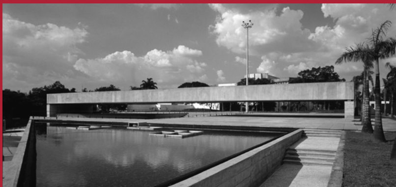
Paulo Mendes da Rocha, Museu da Escultura, São Paulo, 1995.