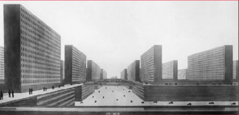
Hibelseimer (Bauhaus), Projeto de uma cidade de arranha-céus, 1927.