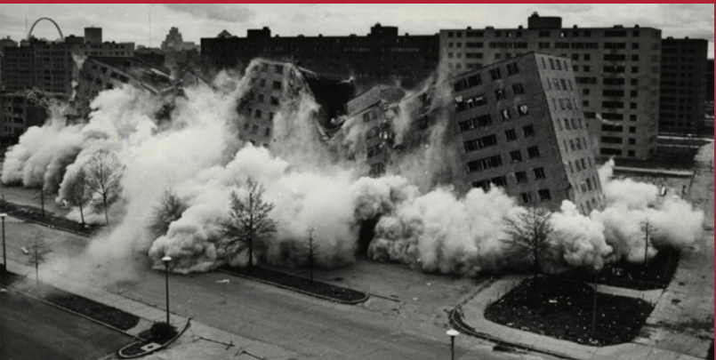
Implosão do Conjunto habitacional de Pruitt Igoe, St Louis, 1971. (Um dos mais prestigiosos conjuntos habitacionais modernos dos Estados Unidos).