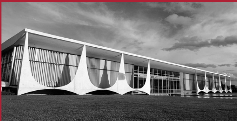
Oscar Niemeyer, Palácio da Alvorada, Brasília, 1958.