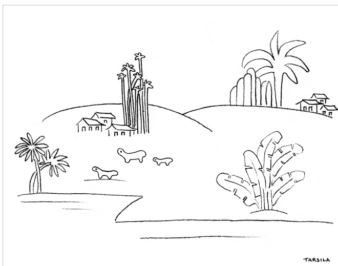
Tarsila do Amaral. Paisagem antropofágica - I , 1929 c – lápis s/ papel, 18,0 x 22,9 cm. Coleção Mário de Andrade. Coleção de Artes Visuais do Instituto de Estudos Brasileiros USP.

O novo tempo do mundo exige dos intelectuais responsabilidades que lhes são intrínsecas: a de tornar a força das ideias parte do movimento de entendimento e transformação do mundo. Os filósofos Otilia Beatriz Fiori Arantes e Paulo Eduardo Arantes cumprem, juntos, há mais de 50 anos, a tarefa da crítica como intelectuais públicos atuantes, transitando entre diversas áreas das humanidades e da cultura, em diferentes audiências e espaços de formação. A coleção Sentimento da Dialética é um lugar de encontro com a obra de Otilia e Paulo Arantes e reafirma o sentido coletivo da sua produção intelectual, reunida e editada em livros digitais gratuitos. É um encontro da sua obra com um público cada vez mais amplo, plural e popular, formado por estudantes e novos intelectuais e ativistas brasileiros. É também um encontro da sua obra com o movimento contemporâneo em defesa do conhecimento livre e desmercantilizado, na produção do comum e de um outro mundo possível.