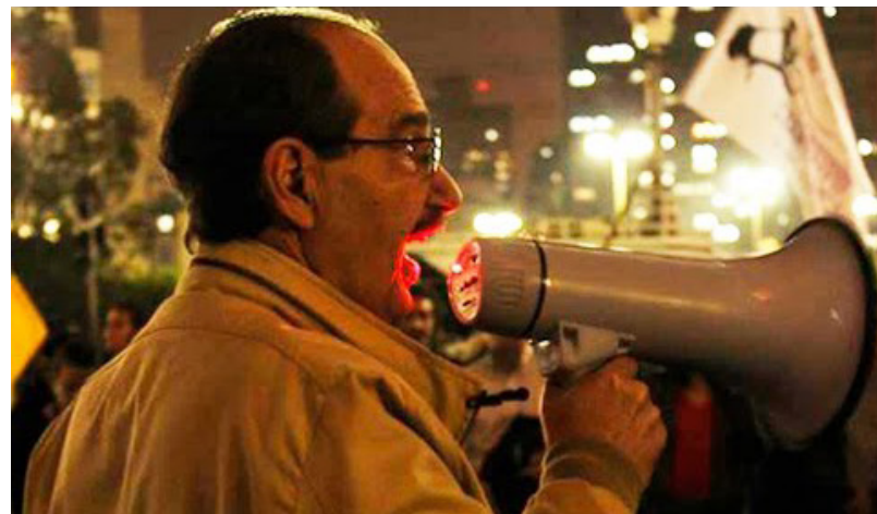
Depois do microfone falhar, a aula seguiu com megafone em mãos.

https://www.youtube.com/watch?v=JDE28pongK8