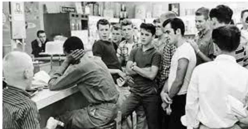
Supremacistas brancos procuram intimidar o movimento, que não parou de crescer e se tornou um marco na história do ativismo.

Analisando o conjunto de casos que compuseram essa febre do Sit-In que contagiou todo o sul dos Estados Unidos, abrangendo diversas estratégias de intervenção política, o jornalista conclui que só o que ele chama de vínculos fortes entre pessoas seria capaz de impulsionar movimentos ativistas de alto risco. E desafiar as leis e costumes segregacionistas do sul dos Estados Unidos envolve altíssimo risco. Muito pior do que cassetete de polícia, a ameaça é de linchamento, e por parte de uma direita organizada e extremamente violenta. A disposição pessoal necessária nesse tipo de ativismo só seria mobilizada com vínculos reais, cara a cara. No caso do movimento negro nos EUA, sustentado pela amizade dos quatro jovens de Greensboro, e de fundo por uma grande coalizão comunitária, organizada principalmente em torno de igrejas e que articulava um projeto estratégico. Ou seja, vínculos que não são, fundamentalmente, aqueles em jogo nas redes sociais.