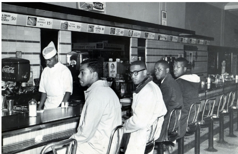
Primeiro Sit-In na lanchonete da loja de departamentos Woolswoths em Greensboro, em 1960.

Analisando o conjunto de casos que compuseram essa febre do Sit-In que contagiou todo o sul dos Estados Unidos, abrangendo diversas estratégias de intervenção política, o jornalista conclui que só o que ele chama de vínculos fortes entre pessoas seria capaz de impulsionar movimentos ativistas de alto risco. E desafiar as leis e costumes segregacionistas do sul dos Estados Unidos envolve altíssimo risco. Muito pior do que cassetete de polícia, a ameaça é de linchamento, e por parte de uma direita organizada e extremamente violenta. A disposição pessoal necessária nesse tipo de ativismo só seria mobilizada com vínculos reais, cara a cara. No caso do movimento negro nos EUA, sustentado pela amizade dos quatro jovens de Greensboro, e de fundo por uma grande coalizão comunitária, organizada principalmente em torno de igrejas e que articulava um projeto estratégico. Ou seja, vínculos que não são, fundamentalmente, aqueles em jogo nas redes sociais.